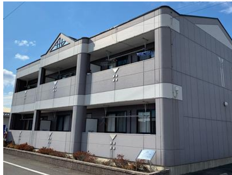
生活に便利な立地