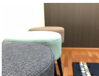
エアコン、TV モニターホン 照明、洗浄付き暖房便座、他