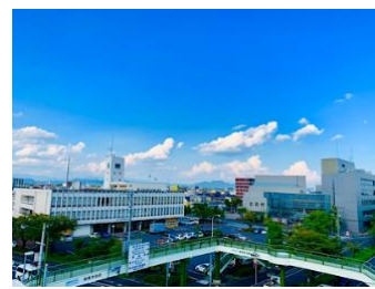
2 km 圏内にスーパーや市役所、 物件周辺は落ち着いた住宅地