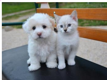
ペットと一緒に暮らせます 飼育時賃料は¥2,500 アップ