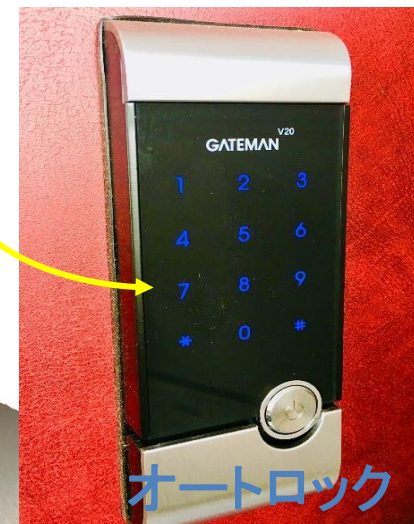
宅配BOX 防犯カメラ 各部屋オートロック