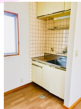
下階のシステムキッチンに加え 上階にはミニキッチンがあり便利