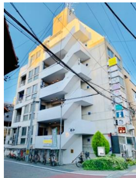
名店や隠れ家的穴場スポットなど いろいろある商業エリア