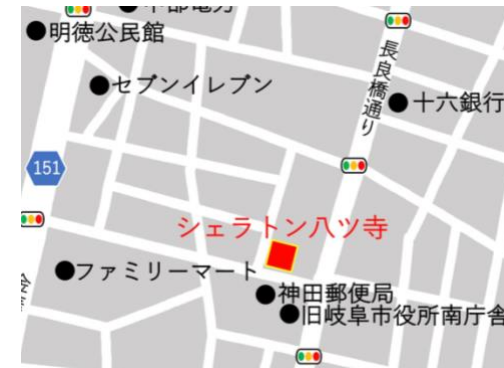
バス通りの長良橋通りまで80m！ 徒歩1分！！