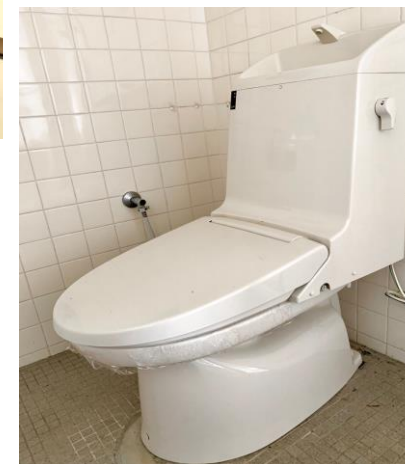
■堀ビル 201(事務所・店舗) ■管理者:岐阜チンタイ管理事務所 / TEL 058-214-8150 ■撮影日:2019年11月19日