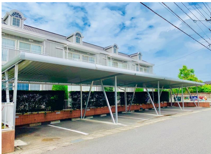
グリーンハウス市川 駐車場区画図