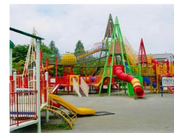
住みやすい・お店が豊富・ 教育水準が高い 人気エリア