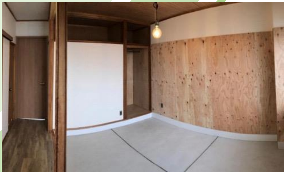
リノベーション物件