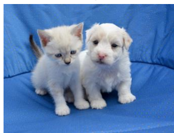
犬 or 猫、ベランダを除く 専有部分で飼育可能