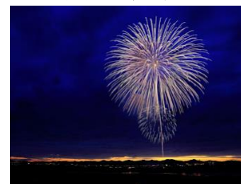
最上階から金華山・ 長良川花火大会をバッチリ眺望