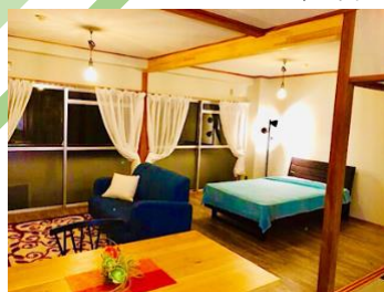
土間の他、細部までこだわった オシャレなお部屋