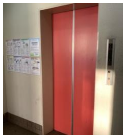
エレベーター完備