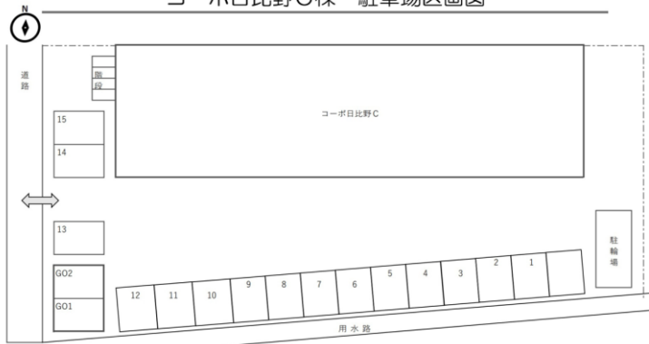
コーポ日比野C棟 駐車場区画図